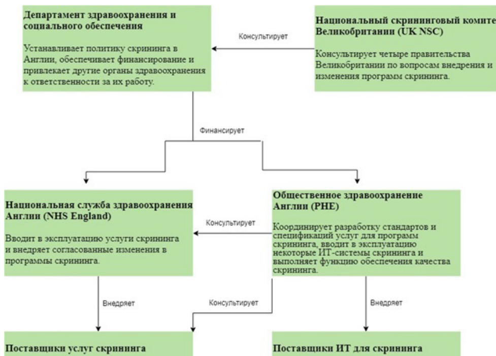
Рисунок 2 - Принятие решения и внедрение скрининга

7. Департамент здравоохранения и социального обеспечения рассматривает рекомендацию, и в случае согласия финансирует Национальную службу здравоохранения Англии (NHS England) и Общественное здравоохранение Англии (PHE) для дальнейшей реализации скрининга (рисунок 2).